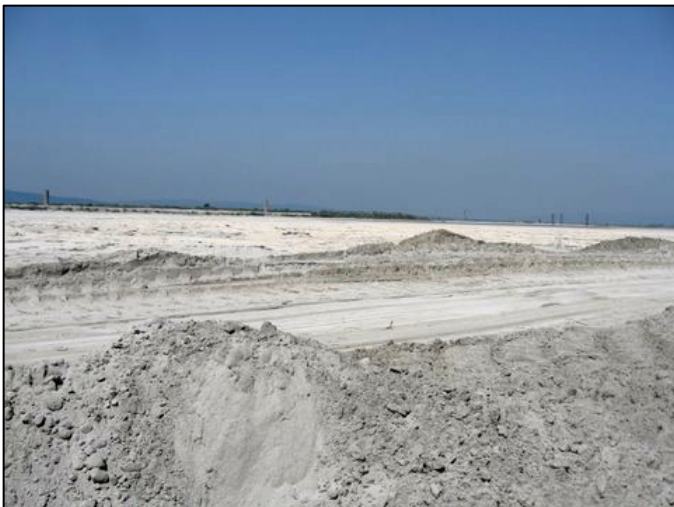
Praful de deșuri miniere în așteptarea primului vânt pentru a ajunge în gospodăriile populației din Clisura Dunării.

Este necesar ca acest aspect să fie aprofundat de către comisia mixtă româno - sârbă privind apele de frontieră iar problema să fie preluată spre rezolvare de către șefii diplomațiilor din cele 2 țări, aceasta până a nu se ajunge în situația ca și Nera să devină un râu pustiu de vegetație și de cântecul păsărilor ca dealtfel multe râuri din pusta Banatului.