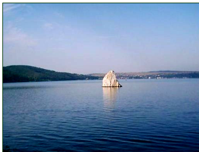
Stâncă Babacaia de la Coronini - Crăiasa tăcută a Dunării

O altă legendă aduce în prim-plan un căpitan al cetății Coronini, care ar fi răpit o cadână din haremul pașei din Golubăț, de pe celălalt mal al Dunării, și ar fi fugit cu ea pe malul stâng. Numai că, în dreptul stâncii Babacai el ar fi fost prins și scurtat de cap.