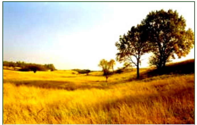
Stepa din Deliblatska Peščara

Dintre reptile trebuie menționate gușterul de stepă ( Podarcis taurica ), șarpele de apă ( Coluber caspius ), gușterul ( Lacerta viridis ), broasca de uscat ( Pelobates syriacus ) iar dintre păsări șoimul dunărean ( Falko cherrug ), acvila de câmp ( Aquila heliaca ), acvila de copaci ( Aquila pomarina ), viesparul ( Pernis apivorus ), pasărea ogorului ( Burchinus oediconemus ), cormoranul mic ( Phalacrocorax pygmaeus ), colonii de lăstuni de mal ( Riparia riparia ).