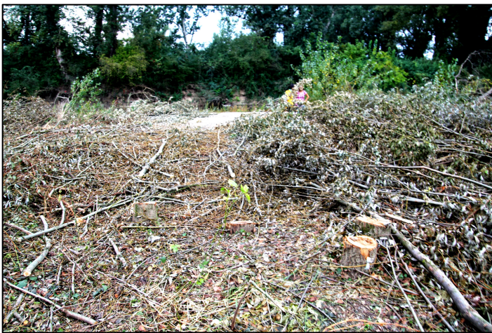
Septembrie 2011 - defrișări masive în zona localității Kusič (Serbia)